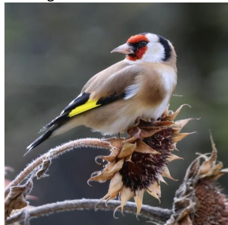
Stieglitz auf Nahrungsquelle

Unsere aktuelle, hochgelobte Ausstellung: Faszinierende Vogelwelt in unserer Region Farbfotografien von Doris Brötz Verlängert bis zum 6. Mai 2024