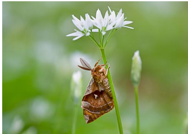
Nagelfleck an Bärlauchblüte

Unsere aktuelle Ausstellung: „Streifzüge im Schönbuch – Natur in Gefahr?“ Fotografien von Werner Schaal