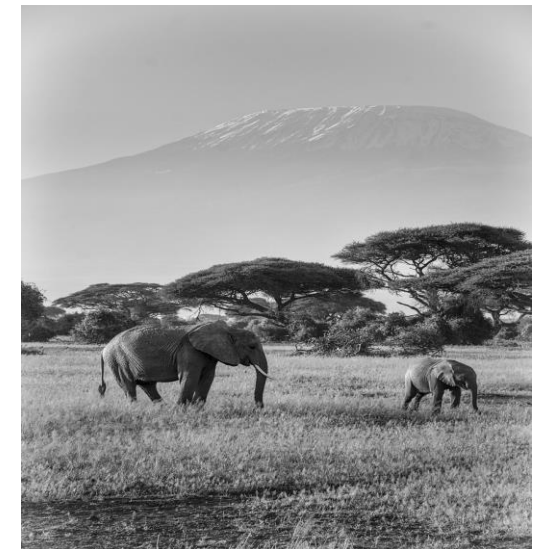
Afrikanische Welten im Stadtteiltreff Wanne....